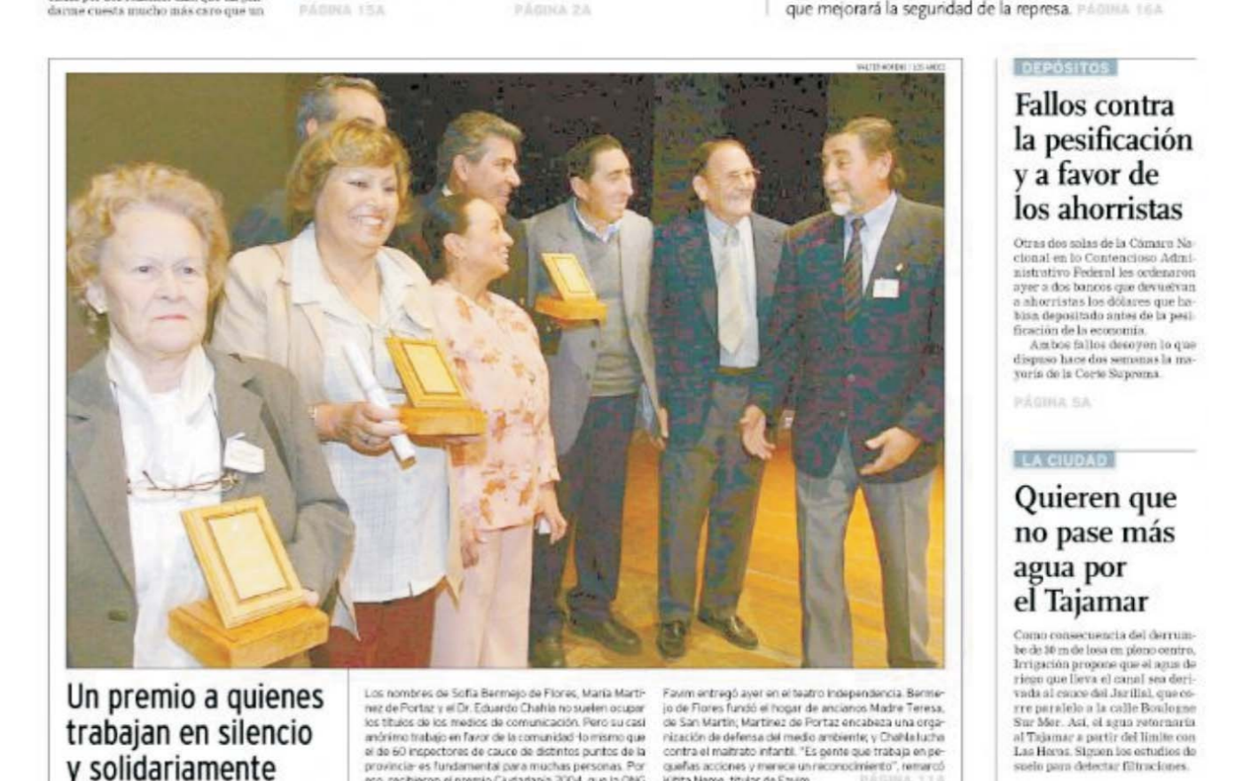
Un premio a quienes trabajan en silencio y solidariamente. Fallos contra la pesificación y a favor de los ahorristas. Quieren que no pase más agua por el Tajarar.

Ya llega mejor agua potable desde Potrerillos Investigaron ayer el acuerdo que traerá el 25% del agua potable para el Gran Mendoza. Es una de las obras programadas. El pacto garantiza mejor calidad de agua. Además, sancionaron un acuerdo por el tiempo que ocupará la ejecución de la obra.